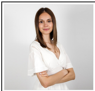
Dama de Honor