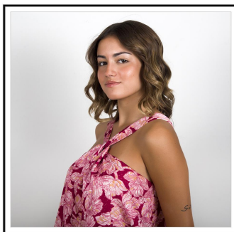
Reina de las fiestas