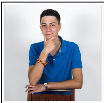
Mister de las fiestas