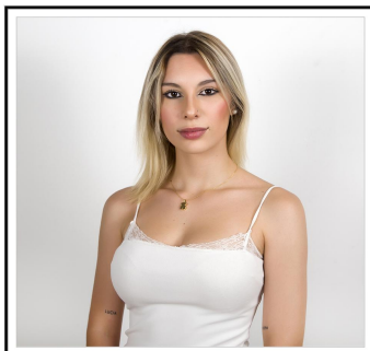
Dama de Honor